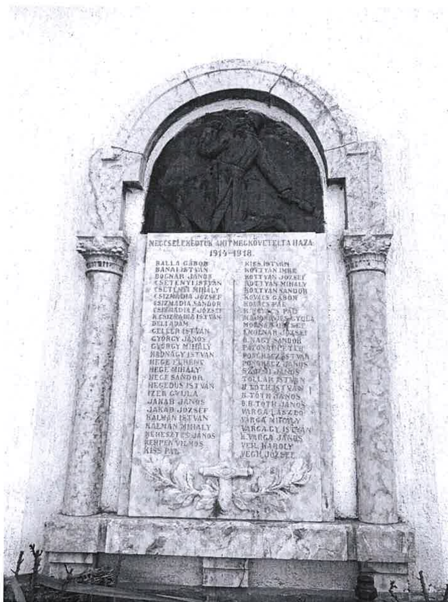
1. ábra I. világháborús emlékmű