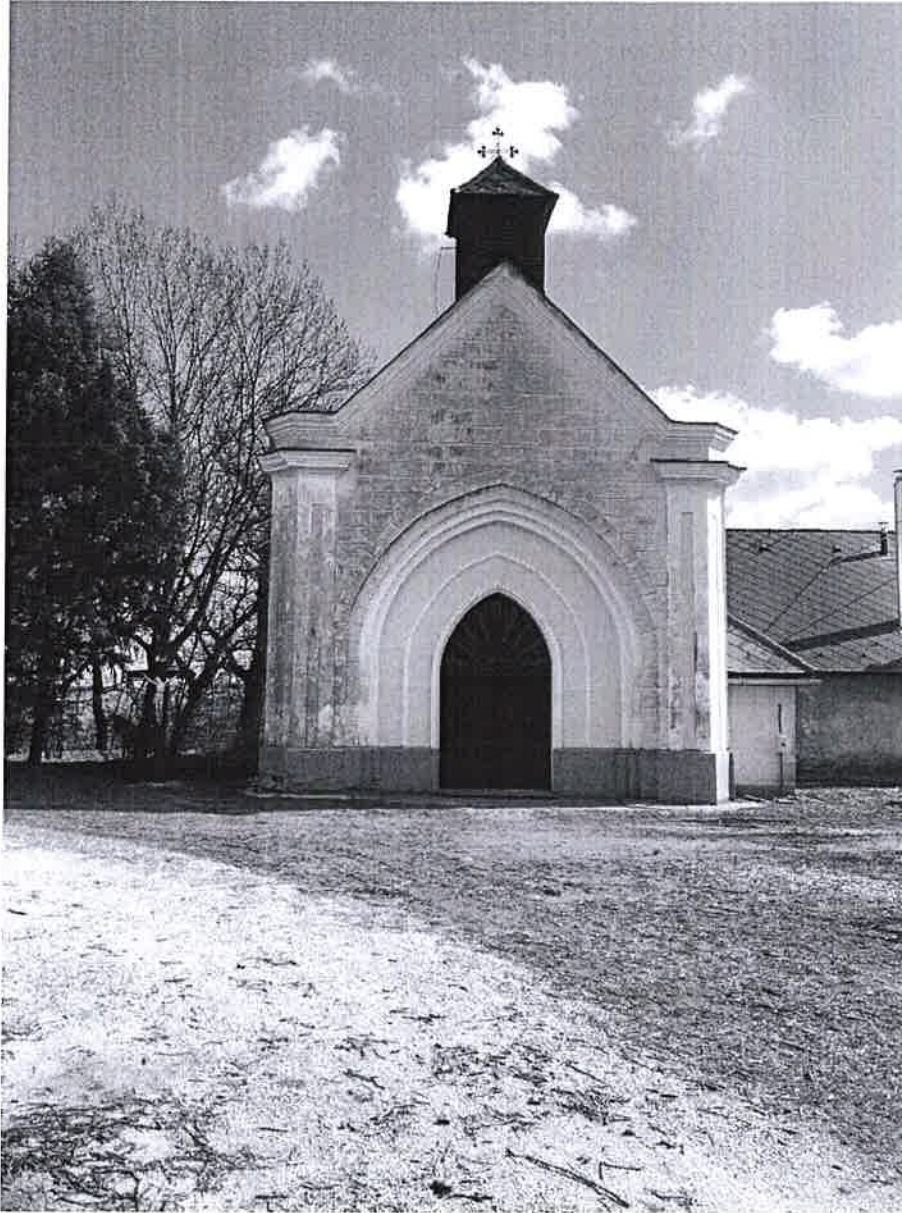
1. ábra Katolikus kápolna épülete