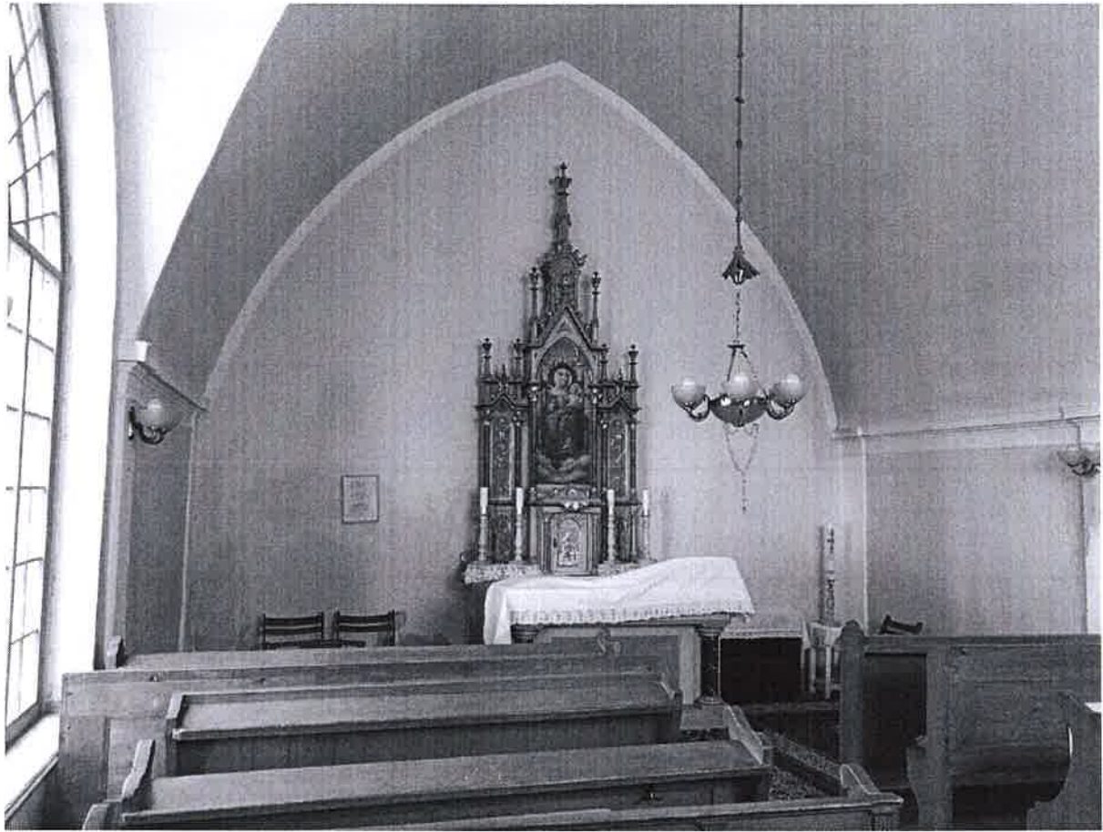
2. ábra Faoltár