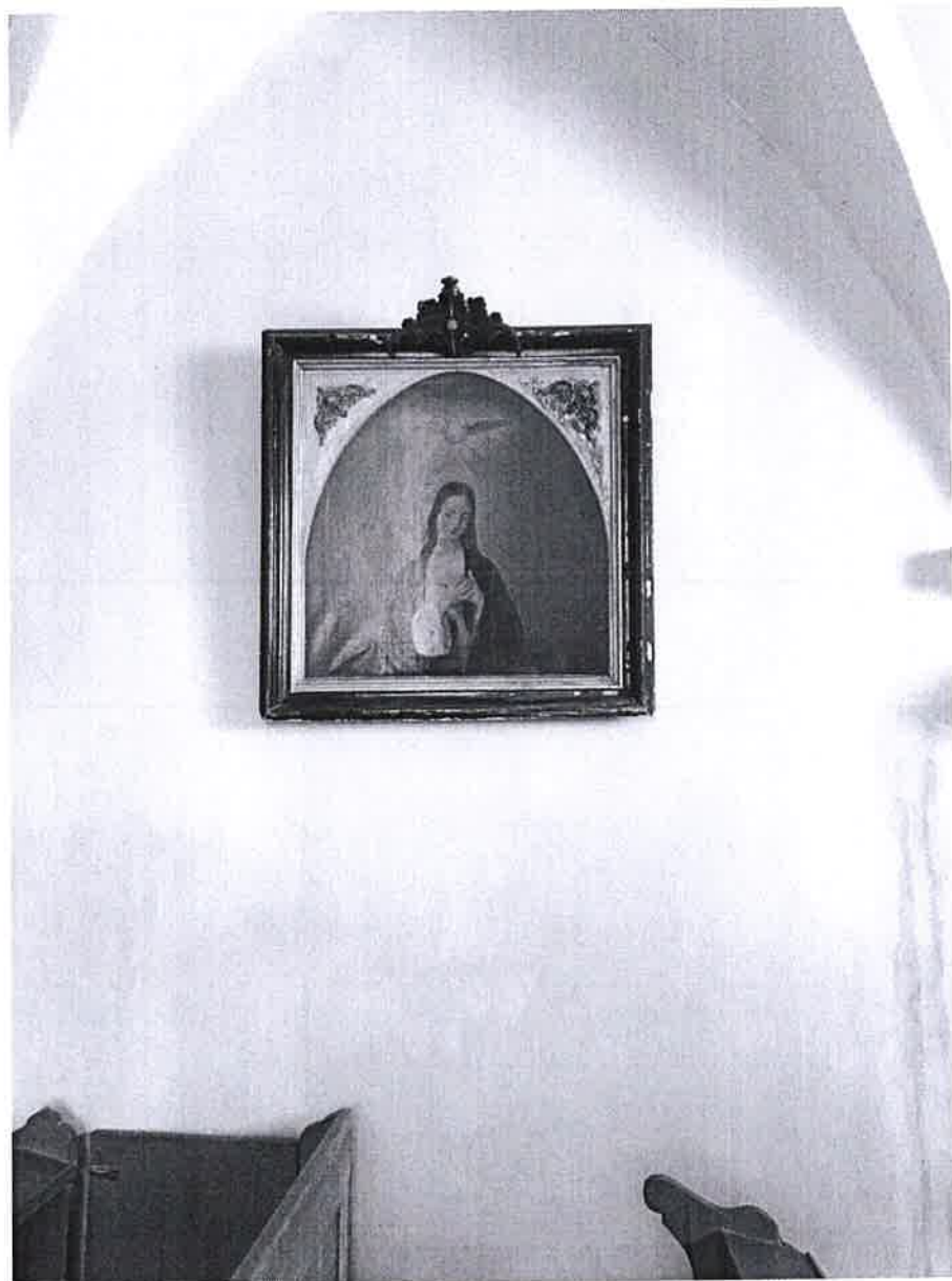
4. ábra Szűz Mária olajkép a kápolna nyugati falán