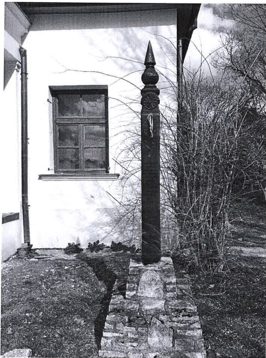
1. ábra 1956-os emlékmű