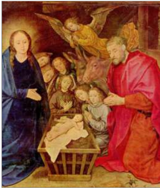
Hugo van der Goes: A pástorok imádása (1440)

KELLEMES KARÁCSONYI ÜNNEPEKET ÉS BOLDOG ÚJ ÉVET KÍVÁN KÖZSÉGÜNK MINDEN LAKÓJÁNAK AZ ÖNKORMÁNYZAT KÉPVISELŐ-TESTÜLETE ÉS A SZERKESZTŐSÉG !